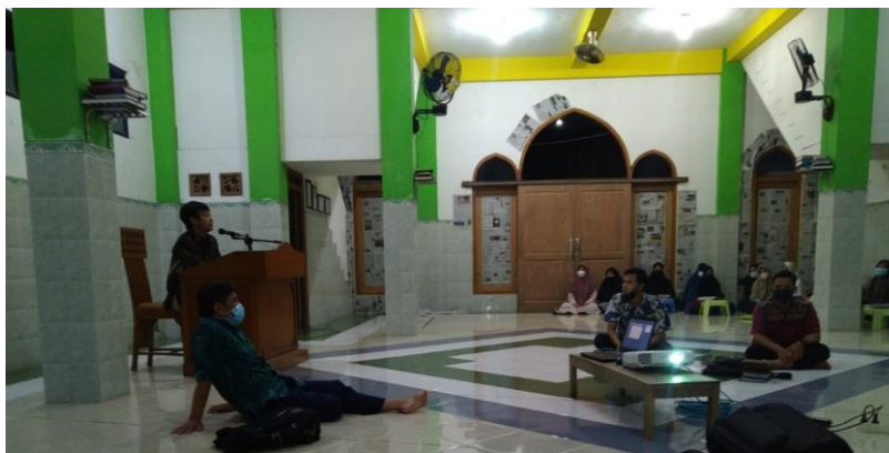
Gambar 1. Pelatihan untuk Operator

Sebagai hasil dari kegiatan pengabdian yaitu membuat workshop dilaksanakan dalam empat tahap, pertama sampai ke tiga diikuti oleh para panitia atau pelaksana pembuat materi video (operator) dan keempat diikuti oleh seluruh audien Majelis Ta'lim masjid Al Mustaqim yang berlokasi di Kelurahan Ngestiharjo, Kecamatan kasihan, Bantul. Pelatihan diadakan secara offline di Masjid Al-Mustaqim. Dengan memberikan materi penggunaan zoom meeting mulai dari cara membuat hingga menggunakan segala bentuk fitur di zoom meeting dan V-Mix untuk membuat tampilan menarik.