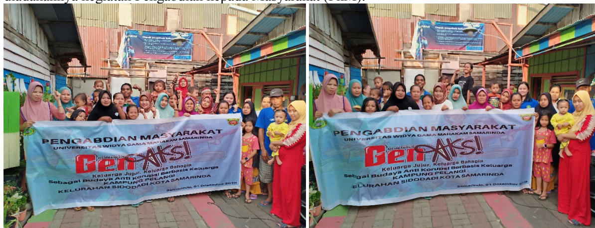
Gambar 4. Foto Bersama Kegiatan Pengabdian Masyarakat

sebagai mitra kegiatan pengabdian masyarakat karena telah interaktif dalam menyampaikan setiap problematika yang dihadapi. Kesepuluh , kegiatan Pengabdian kepada Masyarakat (PkM) mengenai membangun generasi aksi (anti korupsi) keluarga jujur, keluarga bahagia sebagai budaya anti korupsi berbasis keluarga di Kampung Pelangi Kelurahan Sidodadi Kota Samarinda meninggalkan kesan yang menarik, sehingga kedepannya ada keberlanjutan program seperti pelatihan dalam hal pola pengasuhan dan pola komunikasi yang benar dalam rangka menumbuhkan semangat juang melawan korupsi dengan membangun karakter anti korupsi pada keluarga sehingga menghasilkan generasi anti korupsi dari diadakannya kegiatan Pengabdian kepada Masyarakat (PkM).