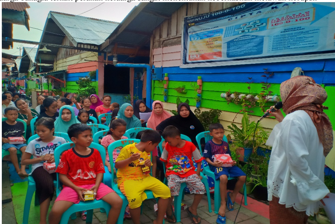
Gambar 2. Penyampaian Materi oleh Narasumber

Kelima , mitra kegiatan pengabdian masyarakat yaitu peserta penyuluhan hukum masyarakat Kampung Pelangi Kelurahan Sidodadi Kota Samarinda menyambut baik dan penuh antusias terhadap keberadaan program membangun budaya anti korupsi berbasis keluarga melalui pembangunan karakter generasi aksi (anti korupsi) dari keluarga jujur, keluarga bahagia yang selaras dengan tujuan Komisi Pemberantasan Korupsi (KPK) terkait bidang pencegahan korupsi. Keenam , mitra kegiatan pengabdian masyarakat yaitu peserta penyuluhan hukum masyarakat Kampung Pelangi Kelurahan Sidodadi Kota Samarinda menyampaikan pandangan terhadap keberadaan program membangun budaya anti korupsi berbasis keluarga melalui pembangunan karakter generasi aksi (anti korupsi) dari keluarga jujur, keluarga bahagia terkait peranan keluarga sangat menentukan keberhasilan melawan korupsi.