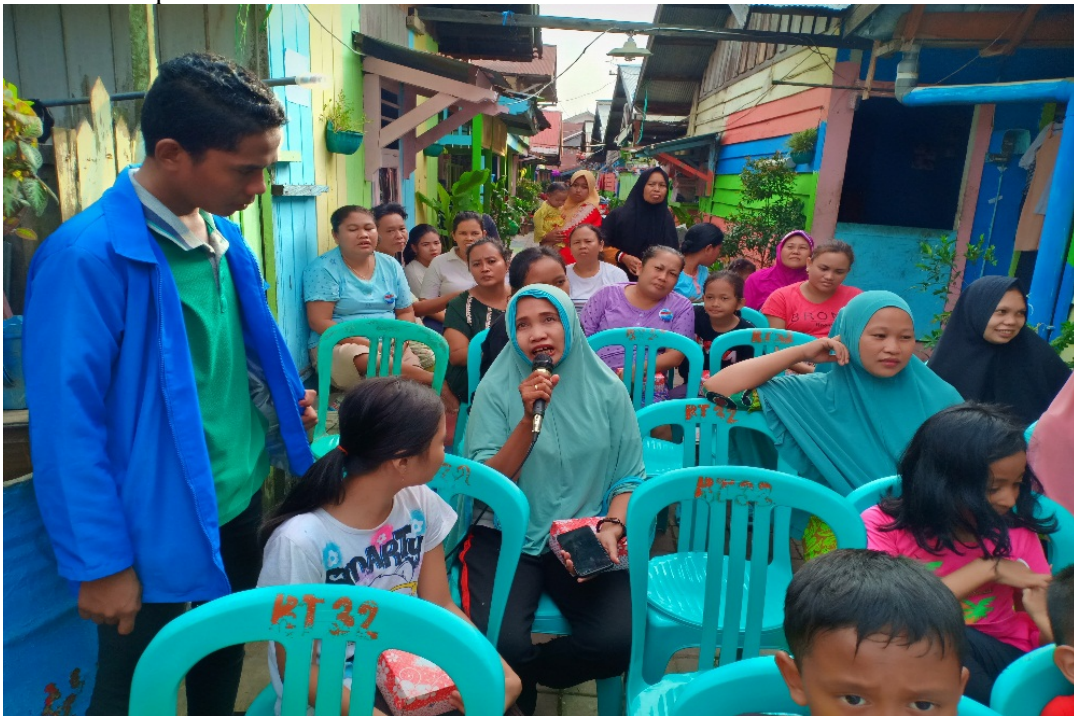
Gambar 3. Diskusi Interaktif Narasumber dengan Peserta

disesuaikan dengan kondisi riil masyarakat yang kurang memahami bahwa melawan korupsi tidak bisa hanya melalui pemberian sanksi namun juga perlu dilakukan dari sisi pencegahan yang melibatkan banyak lini kehidupan.